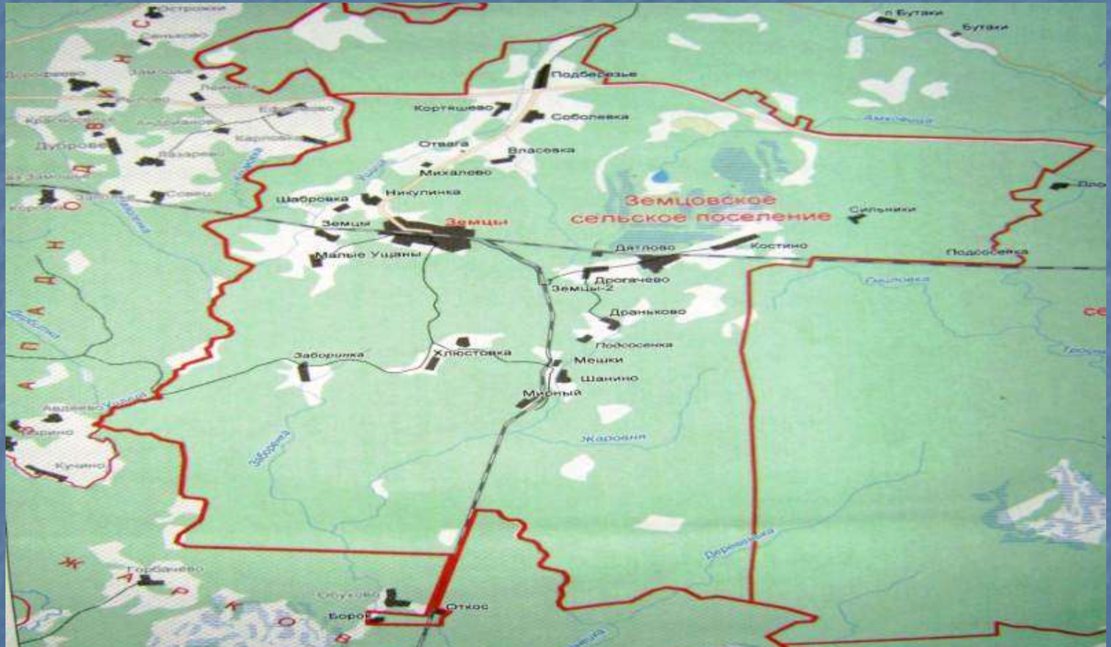
Карта Земцовского сельского поселения