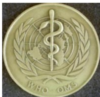
Медаль с эмблемой

Через много лет, если язву не лечить, то в месте язвы кишечник становится уже. Это мешает нормальному процессу пищеварения.