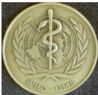
Медаль с эмблемой