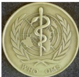
Медаль с эмблемой

Следует помнить: при концентрации алкоголя в крови 0,5-0,6% (соответствует 0,5л водки) у подростка может наступить СМЕРТЬ .