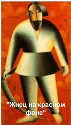
"Жнец на красном фоне"

Был ли Малевич всего лишь художником-недоучкой? Достиг бы он высоких творческих вершин, если бы пытался реализовать свой талант в классических направлениях живописи? Эти вопросы никогда не найдут своего ответа.