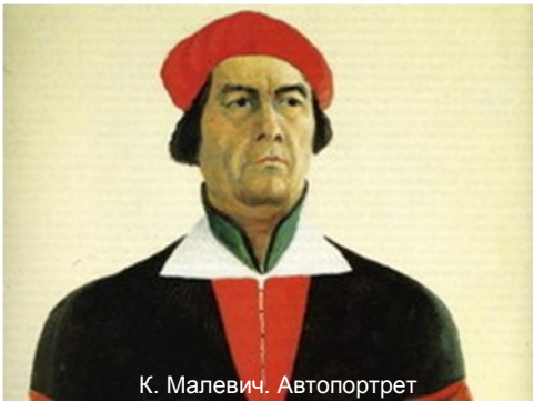
К. Малевич. Автопортрет

23 февраля 1878 года родился Казимир Малевич. В советское время на протяжении многих лет имя Казимира Малевича находилось под негласным запретом. Сам художник в течение своей жизни также немало способствовал тому, чтобы максимально запутать факты личной и творческой биографии, предельно затруднить любые попытки внешнего проникновения в то удивительное явление, тот сгусток тонкой психической энергии, который мы называем Казимиром Малевичем.